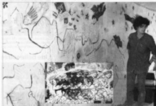
Zeillim devant une de ses œuvres, il présente des peintures sur le thème de l'ivresse.

L'artiste peintre se définit lui-même comme un pariétal égaré dans le temps qui aurait remplacé les parois de sa grotte par des surfaces plus modernes.