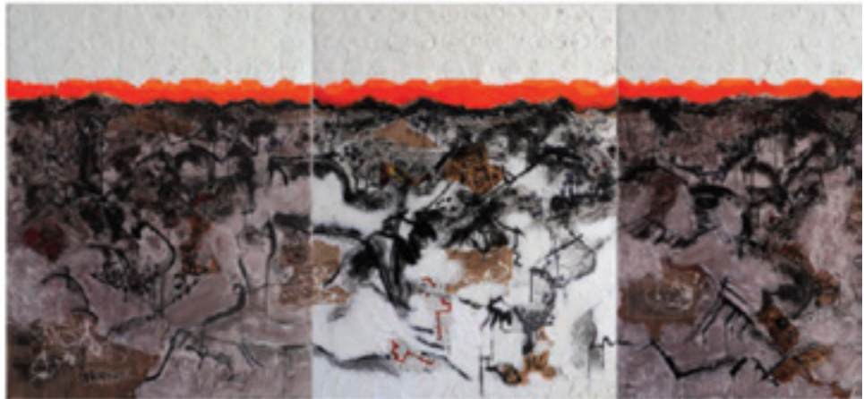
« Aliénations paysagères » 6, 7 et 8.

Durant une longue année, en deux temps, après une série de dessins, trois, puis treize panneaux au total ont été réalisés. Un des trois premiers est celui qui ouvre et ferme l'exposition : il est presque tout blanc, c'est l'anéantissement. Les autres vont par deux ou trois et dessinent des moments intermédiaires. Ils sont accompagnés de