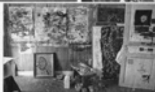
Zeillim dans la salle d'exposition de son atelier, les salles où il travaille et le coin "sculpture" et dessins.

mais les dans à la fois, graphique et plastique, montrent le talent métrique aussi bien que l'ambiguïté. Zeillim construit un univers où la tradition et la modernité se font la toile de fond. ELNE.