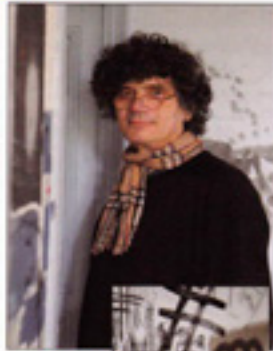
Zeillim a décidé d'ouvrir son atelier. Une enrichissante expérience de confrontations avec le public, mais aussi d'autres arts.