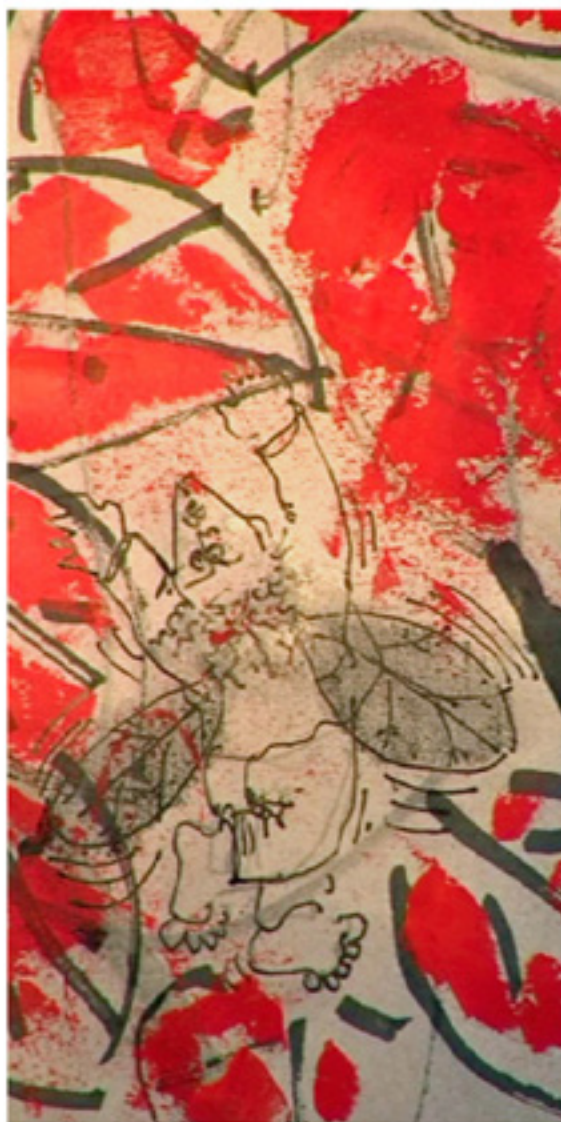
Explosion de couleurs et de formes, l'art selon Zeillim.

Publié le 04/09/2014 à 15H03, mis à jour le 04/09/2014 à 15H41