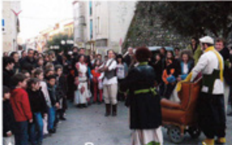
AUTOUR DU PRINTEMPS DES POÈTES

Comme tous les ans, la Médiathèque d'Elne a inscrit l'une de ses actions culturelles majeures dans le cadre de la manifestation nationale du Printemps des Poètes, dont le thème en 2012 était « Enfances ».